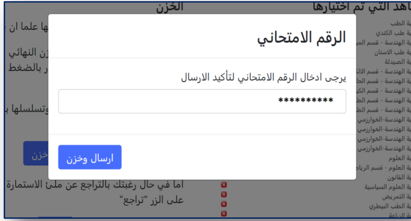
الشكل رقم (١٣)

وبعد كتابة الرقم الامتحاني لتأكيد الارسال والضغط على الزر (ارسال وخن) سيتم ارسال خياراتك وخنها ويتم اعتماد الاستمارة بشكل نهائي . في حال نجاح الخزن ستظهر لك الرسالة الموضحة في الشكل (١٤) لتمكنك من سحب الوصل (استمارة التقديم الالكتروني) الخاص بك والمثبت فيه إختياراتك المخزونة.